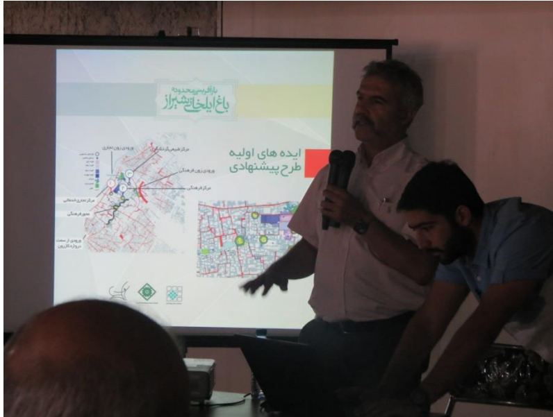
دومین روز برگزاری کارگاه آموزش تجارب مرمتی (مورخ: ۹۵/۳/۱۲)